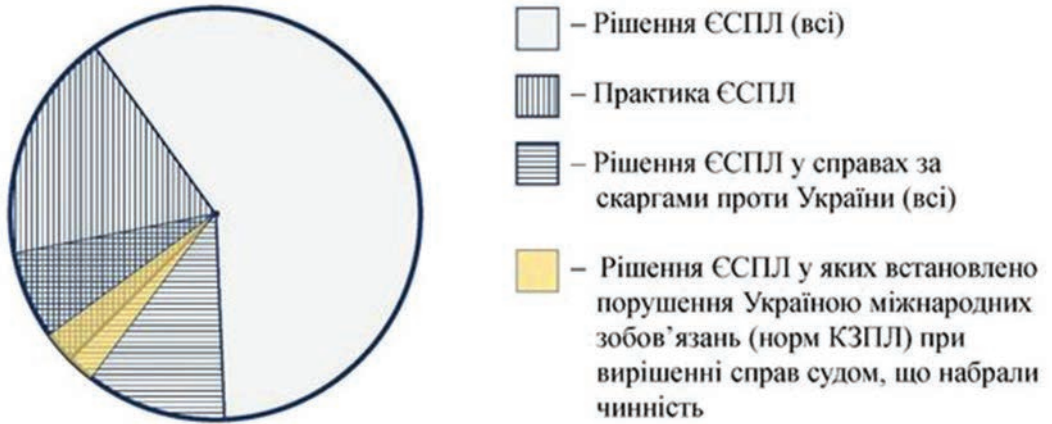
Рис. 1. Умовна візуалізація співвідношення категорії «практика ЄСПЛ» з суміжними категоріями

Таким чином, рішення ЄСПЛ, у яких встановлено порушення Україною міжнародних зобов'язань (норм КЗПЛ) при вирішенні справи судом, що набрало чинність, є підставою для ініціювання кримінальної процесуальної процедури з перегляду судового рішення за виключними обставинами (Див. рис. 2), а тому має прямий процесуальний вплив на рух конкретного кримінального провадження (ілюструючи правозастосовний характер цієї категорії рішень ЄСПЛ) та виконує роль ініціювання механізму забезпечення належного та ефективного захисту прав і свобод людини в кримінальному провадженні.