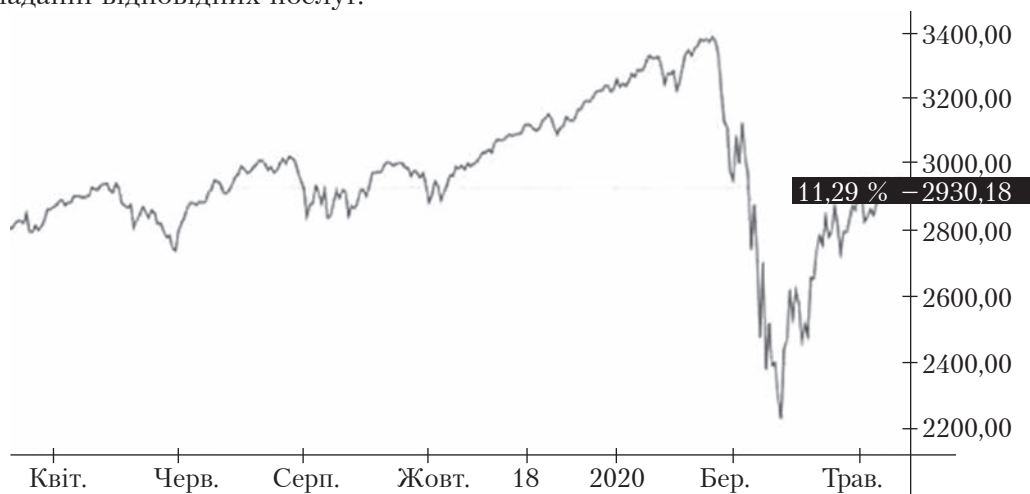
Рис. 2. Динаміка індексу S&P 500 за період квітень 2019 р. – травень 2020 р. [7]

деякі зникають, бо не є гнучкими до змін у законодавчому регулюванні. Так, на сьогоднішній день функціонує 6 фондових бірж, коли, наприклад, в 2016 році їх було 11 [9, с. 131]. Проте невелика кількість фондових бірж є більше позитивним моментом, ніж негативним, оскільки на ринку залишаються найбільш сильніші, тобто ті, які показують більш ефективні результати та надійність у наданні відповідних послуг.