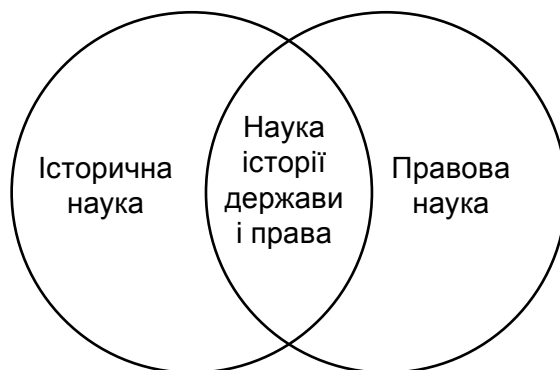
Рис.1 Місце науки історії держави і права в науковому пізнанні

сумнівно, такий дещо дихотомічний погляд на історію держави і права є цілком обґрунтованим і допомагає вирішити низку завдань методологічного спрямування. Однак, якщо виходити з точки зору, що основним джерелом дійсно об'єктивного знання про історію держави є історико-правовий документ, то відособленість держави і права як феноменів стає досить умовною. Інакше кажучи, в контексті історичного пізнання вивчення держави розпочинається й триває в історико-правовому полі. Таким чином, об'єкт і предмет історії держави і права як науки й навчальної дисципліни органічно поєднують історичне минуле й феномен права в самому широкому сенсі. Про правильність цієї тези свідчить і місце, яке посідає в науковому пізнанні історія держави і права. Схематично це можна відобразити наступним чином: